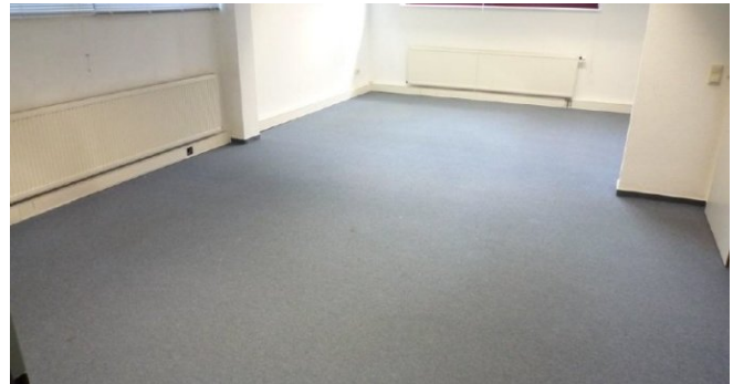
Büro 2 UG