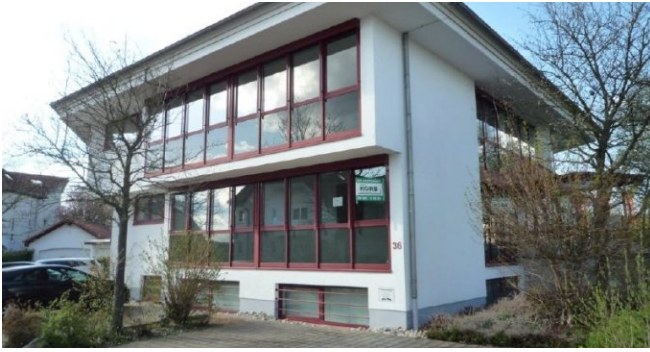
seitl ansicht 3