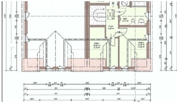
grundriss REH OG