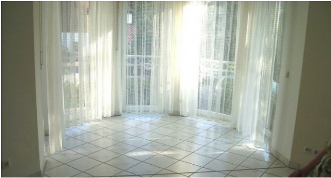
wohnen mit erker