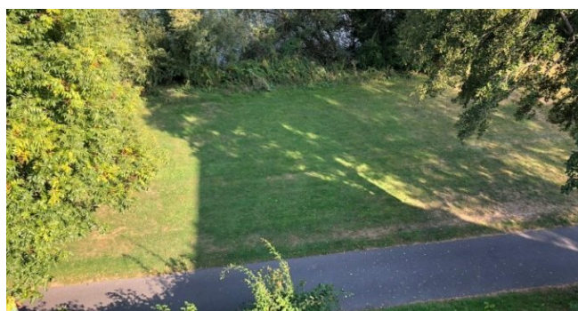
blick vom balkon