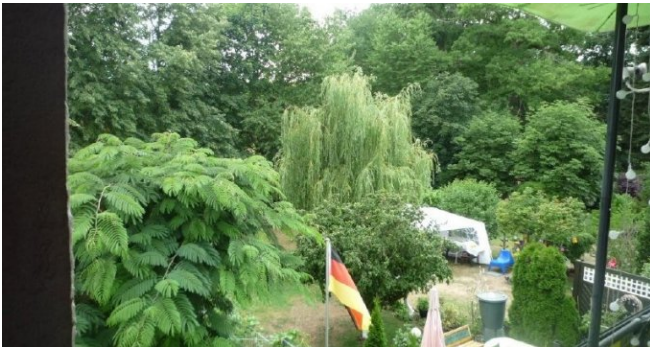
blick in den garten